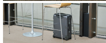
座下には荷物を入れるための収納スペースがあります。

フレーム ……φ15.9スチールパイプ クロームメッキ(C) 塗装ブラック(M) 背・座 ……成型合板 メラミン化粧板 平積み脚数 ……2脚、スタッキング可能