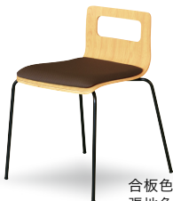
合板色 ナチュラル 張地色 Fブラウン