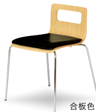
合板色 ナチュラル 張地色 ブラック