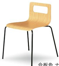
合板色 ナチュラル