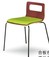
合板色 ブラウン 張地色 グライム