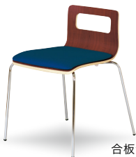
合板色 ブラウン 張地色 Fブルー