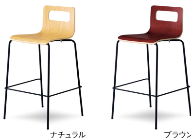
ナチュラル ブラウン