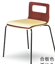
合板色 ブラウン 張地色 アイボリー