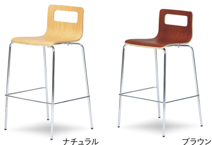
ナチュラル ブラウン