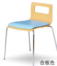
合板色 ナチュラル 張地色 Gアックア