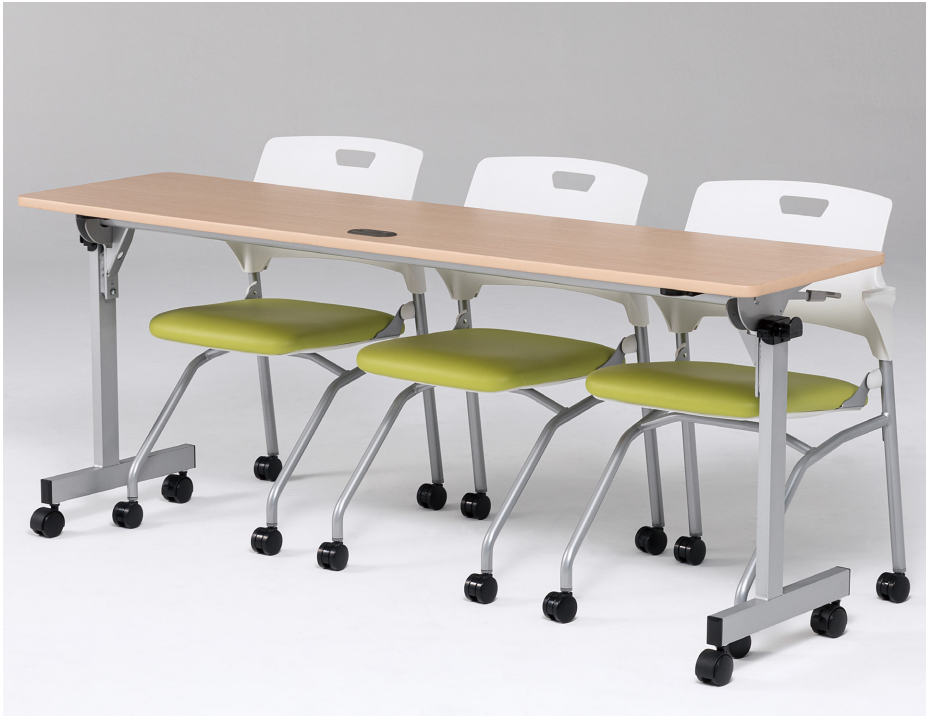
テーブル:TM1845TFN-M チェア:CM558-MXC >> P50