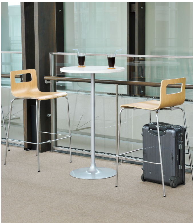
チェア:CD83H-CN ▶▶ P105