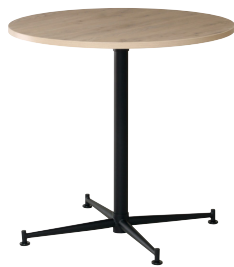
ミディアムオーク