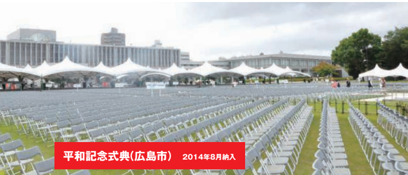
平和記念式典(広島市) 2014年8月納入