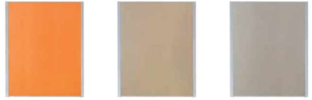
MP-1512AB(オレンジ) MP-1512AB(ベージュ) MP-1512AB(グレー)