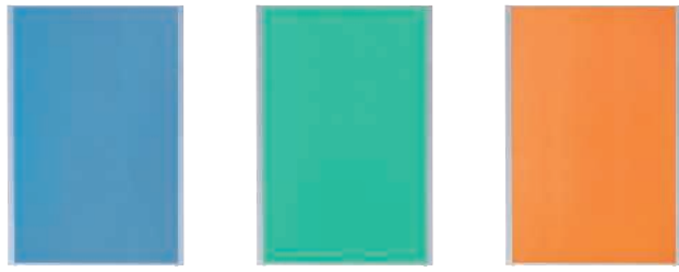
MP-1812AB(ブルー) MP-1812AB(グリーン) MP-1812AB(オレンジ)