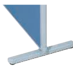
安定脚(アジャスター付) MP-F