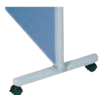
安定脚(キャスター付) MP-FK