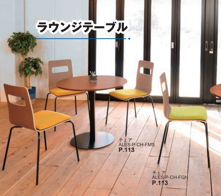
チェア ALES-P-CH-FMS P.113