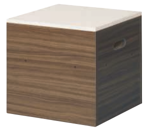
KUMI-450H (WN) + KUMI-450T (WH)