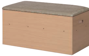
KUMI-900H (NA) + KUMI-900F (GJ)