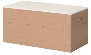
KUMI-900H (NA) + KUMI-900T (WH)