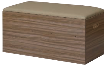
KUMI-900H (WN) + KUMI-900F (BJ)