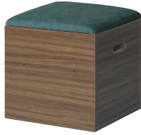
KUMI-450H (WN) + KUMI-450F (TQ)