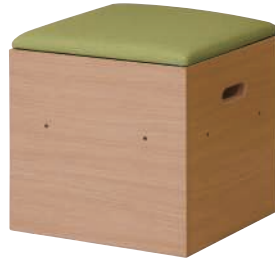
KUMI-450H (NA) + KUMI-450F (GN)