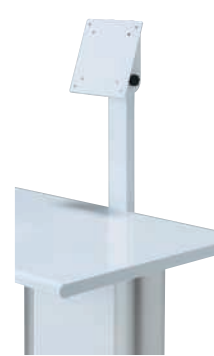
モニター取付金具