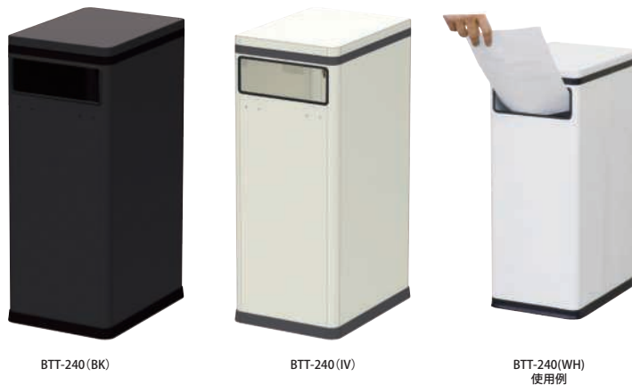
BTT-240 (BK) BTT-240 (IV) BTT-240 (WH) 使用例