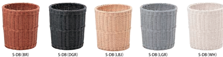
S-DB (BR) S-DB (DGR) S-DB (LBJ) S-DB (LGR) S-DB (WH)