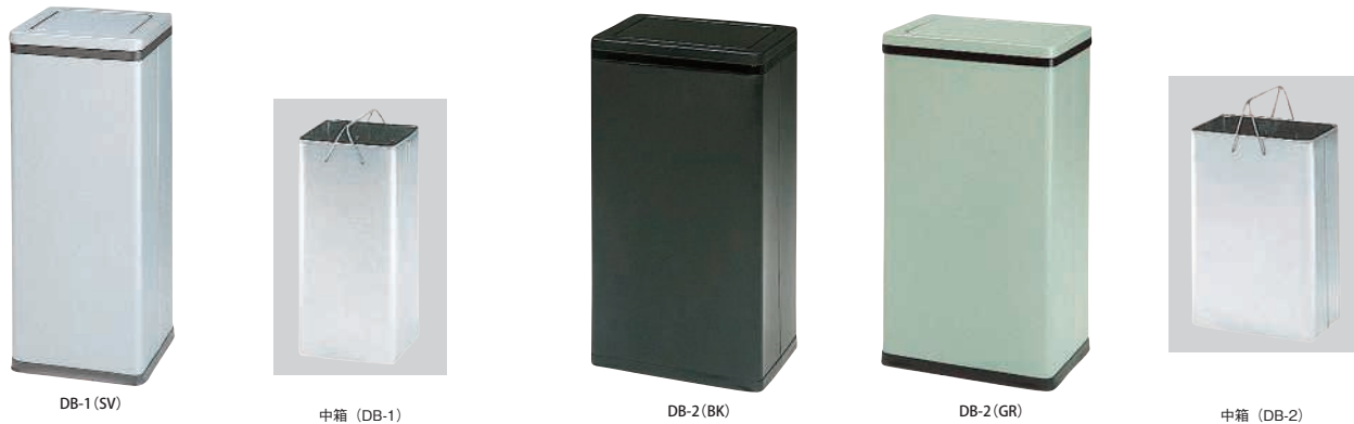
DB-1 (SV) 中箱 (DB-1) DB-2 (BK) DB-2 (GR) 中箱 (DB-2)