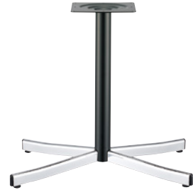
クローム(塗装パイプ)