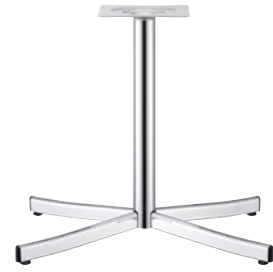
クローム(メッキパイプ)

(別売) No.350 簡易ボックスレンチ ¥700 この製品を組立てるには上記専用工具が必要です。