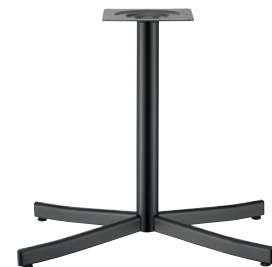
黒粉体(塗装パイプ)