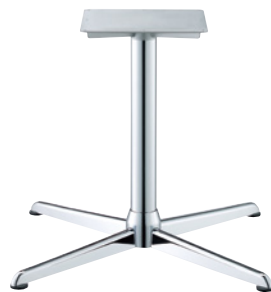
クローム(メッキパイプ)