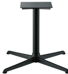
黒粉体(塗装パイプ)