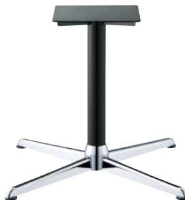
クローム(塗装パイプ)