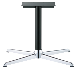
クローム(塗装パイプ)