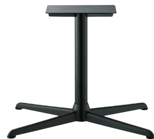
黒粉体(塗装パイプ)