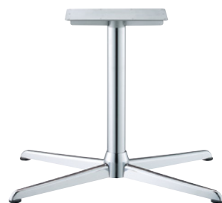
クローム(メッキパイプ)