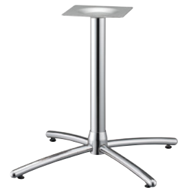
クローム(メッキパイプ)

(別売) No.350 簡易ボックスレンチ ¥700 この製品を組立てるには上記専用工具が必要です。