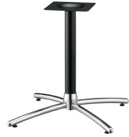
クローム(塗装パイプ)