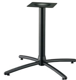
黒粉体(塗装パイプ)