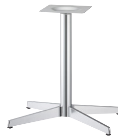
ショットクローム(メッキパイプ)