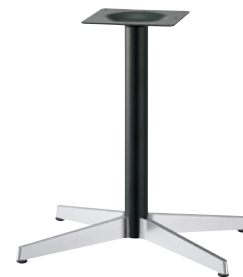
ショットクローム(塗装パイプ)