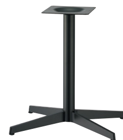
黒粉体(塗装パイプ)