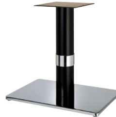
クローム(塗装パイプ) Crリング