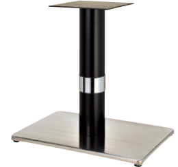
ステンレス(塗装パイプ) Crリング