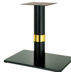
黒粉体(塗装パイプ) Gリング