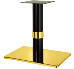
ゴールド(塗装パイプ) Gリング