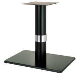
黒粉体(塗装パイプ) Crリング