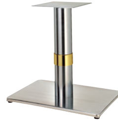
ステンレス(ステンレスパイプ) Gリング