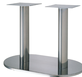
ステンレス(ステンレスパイプ)