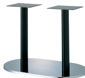
クローム(塗装パイプ)