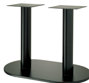
黒粉体(塗装パイプ)