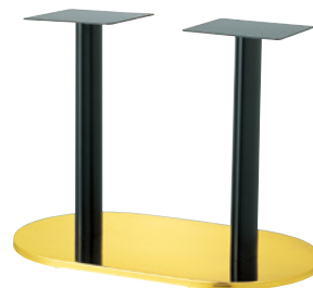
ゴールド(塗装パイプ)