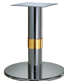
ステンレス(ステンレスパイプ) Gリング