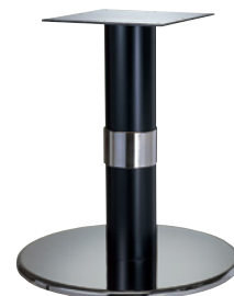
ステンレス(塗装パイプ) Crリング