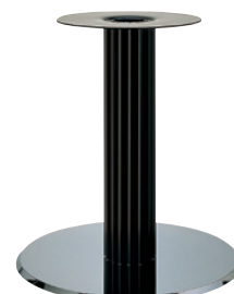
クローム(塗装パイプ)