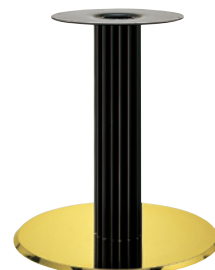
ゴールド(塗装パイプ)