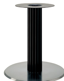
ステンレスヘア(塗装パイプ)