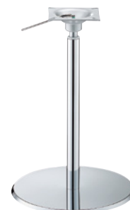
クローム(メッキパイプ)