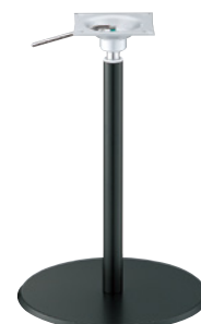
黒粉体(塗装パイプ)