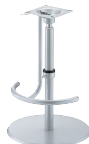
I41粉体(塗装パイプ) I41足掛