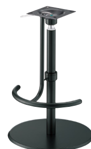
黒粉体(塗装パイプ) 黒足掛