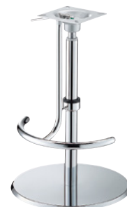
クローム(メッキパイプ) Cr足掛