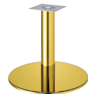
ゴールド(メッキパイプ)