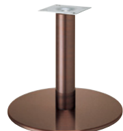
ジービー(メッキパイプ)