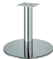
クローム(メッキパイプ)