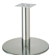
ステンレス(ステンレスパイプ)