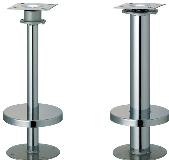
リターン42・50・60 (No.607カバー)