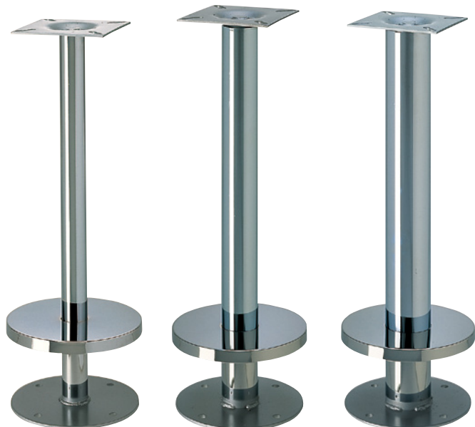
スティック42 (No.607カバー)