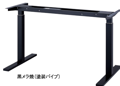
黒メラ焼(塗装パイプ)