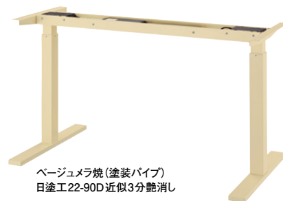
ベージュメラ焼(塗装パイプ) 日塗工22-90D 近似3分艶消し