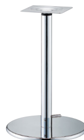
クローム(メッキパイプ)