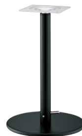
黒粉体(塗装パイプ)