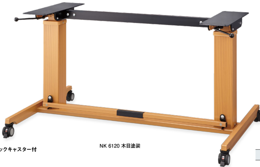
リフトロックキャスター付